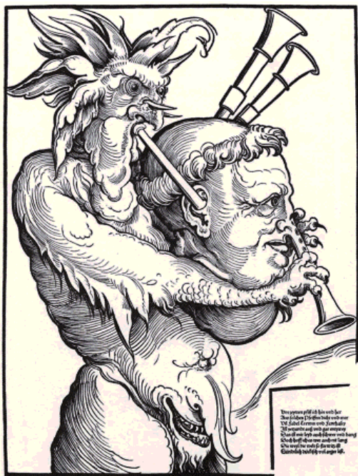
Abb. 7 , Erhard Schoen, „Des Teufels Dudelsack“. 6

Sie sehen, das bildpublizistische Dreigestirn der Reformationszeit Luther-Cranach-Melanchton betätigte sich nicht nur als Erfinder von Bildsatiren sondern baute diese sogar auf dem Aberglauben der einfachen Leute auf.