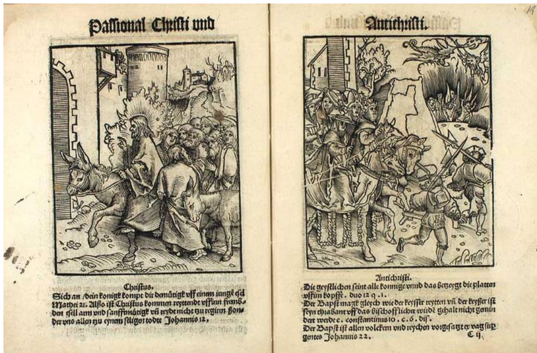
Abb. 4, „Passional Christi und Antichristi“. 3

Das ist eine Doppelseite aus der Passional Christi und Antichristi . Eine Holzschnittfolge, die mit Luthers Duldung 1521 in Cranachs Werkstatt entstand. Also in der Zeit als Luther auf dem Reichstag in Worms nicht wie verlangt von seiner reformatorischen Lehre abschwor und zuvor die, gegen ihn gerichtete päpstliche Bannbulle, öffentlich verbrannt hatte.