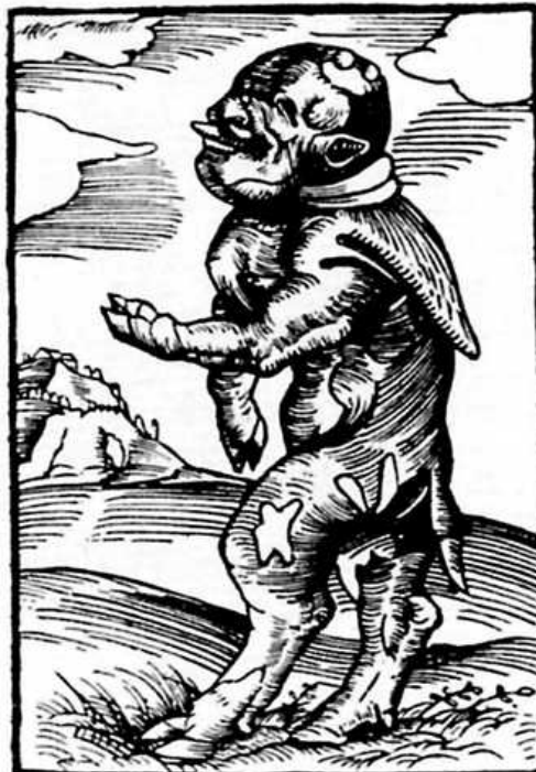
Abb. 6, Papstesel und Mönchskalb. 5

1523 publizierte Luther gemeinsam mit Philipp Melanchthon ein Büchlein mit dem Titel „Deutung der czwo grewlichen Figuren Bapstesel czu Rom und Munchskalb zu Freyberg“.