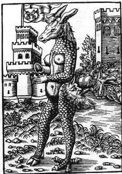
Durch Herrn Philippum Melancthon.