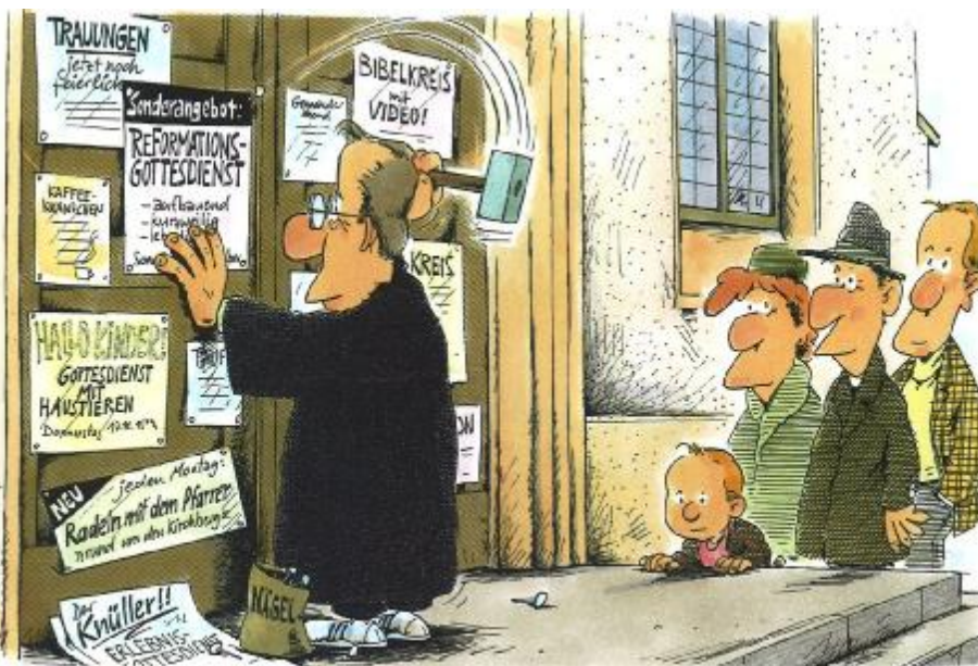
Abb. 1, Gerhard Mester, Ausst. - Katalog S. 43.

Zu welch' einem Balanceakt zwischen Glaube und Kommerz das führt und welche Blüten dieser Reformprozess zuweilen treibt, vergegenwärtigen in hervorragender Weise die hier gezeigten Karikaturen.